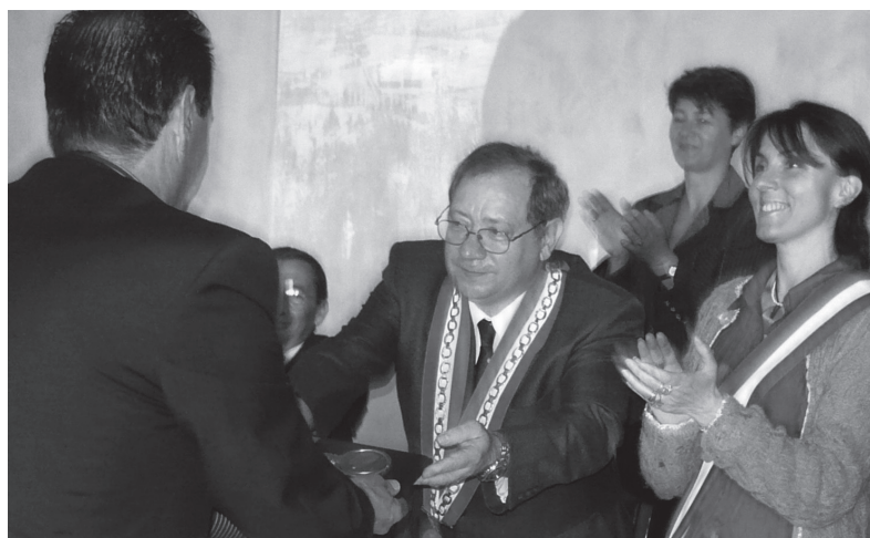
Remise des clefs de Massieux à Oricola

Maintenant que ce projet -dont l'idée est née au